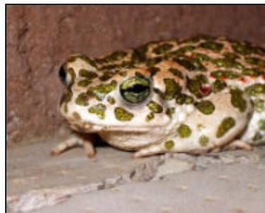
קרפדה ירוקה גודלה עד 10 ס"מ אורך חייה עד 35 שנה פעילה בעקר בלילה