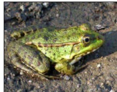
צפרדע הנחלים גודלה עד 14 ס"מ פעילה בעיקר בלילה